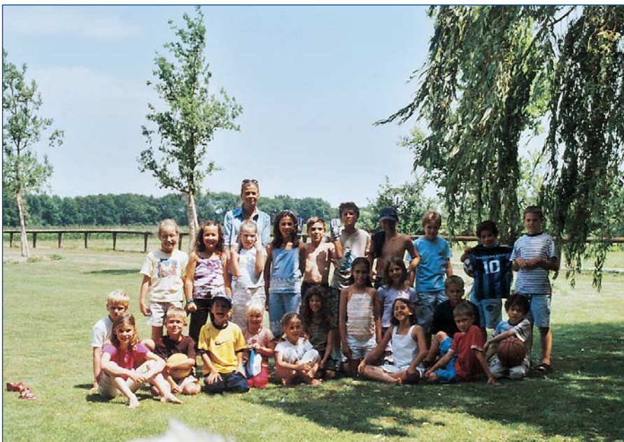
Tous les enfants de la Caf'au Sorbier

La cafétéria fonctionne sur une base de bénévolat et le groupe de responsables en place partage volontiers ses responsabilités avec de nouvelles recrues compétentes et disponibles. Avis aux amatrices et amateurs !