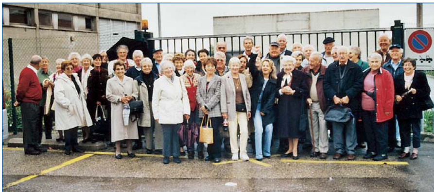
Sortie des aînés le jeudi 26 septembre 2002 à Expo 02